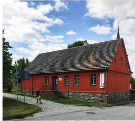
Spielzeugmuseum in Kleßen